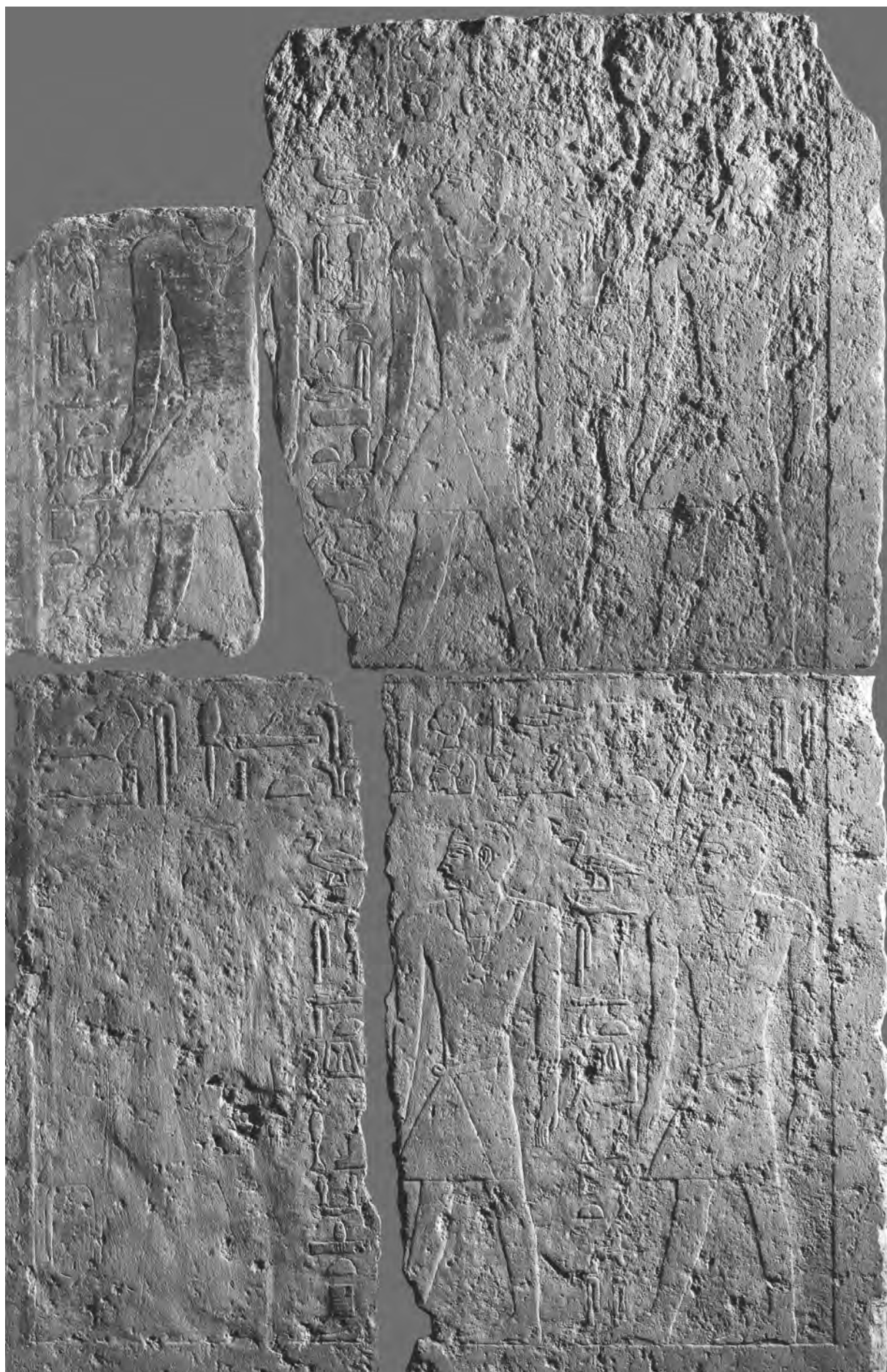
Obr. 5 Ptašepsešovi synové na jižní stěně průchodu ze sloupového vestibulu do obětní síně Ptašepsešovy mastaby / Fig. 5 The sons of Ptašepsešes on the south wall of the passage leading from the vestibule into the offering room in the mastaba of Ptašepsešes