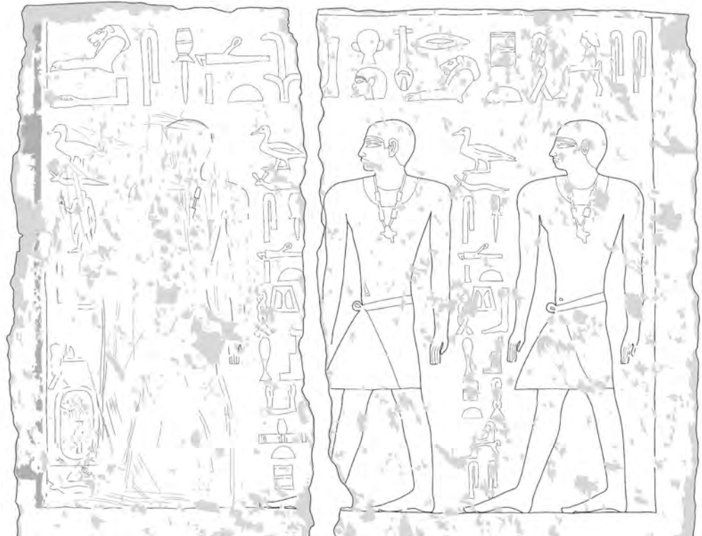
Obr. 6 Spodní registr scény s Ptašepesovými syny se stesaným prvorozeným Chafinim (kresba J. Malátková) / Fig. 6 Lower register of the scene with the sons of Ptašepes, with a removed depiction of the first-born son Chafini (drawing J. Malátková)

těsně kolem zahájení stavby, ve zhruba 10. roce Niuserreovy vlády. Vedle výše zmíněných stavebních graffit by mohlo jít o další nepřímý doklad toho, že ke sňatku Ptašepese s Chamerernebtej došlo ještě před započítím stavby a že Chamerernebtej byla matkou všech zobrazených dětí.