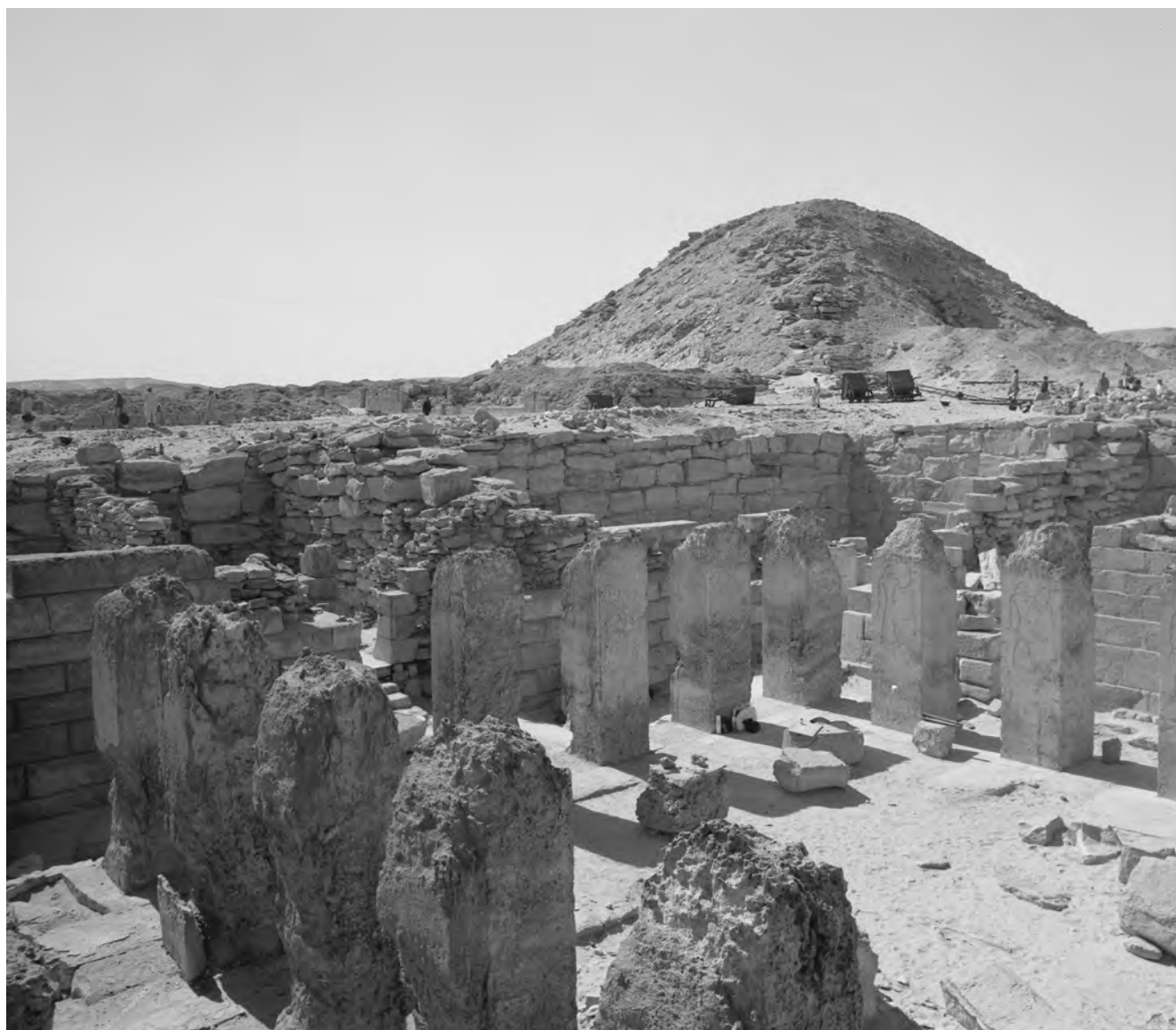
Obr. 2 Pohled na pilířový dvůr Ptahšepsesovy mastaby. V pozadí je Nuserreova pyramida / Fig. 2 View of the pillared courtyard of the mastaba of Ptahshepses, with the pyramid of Nyuserre in the background

dobře promyšlené a přesahovalo rámec pouhého získávání archeologických zkušeností. Schválením jeho žádosti se totiž tým našeho nově vzniklého ústavu zařadil do mezinárodního „elitního klubu“ archeologů zkoumajících památky v jedné z nejcennějších archeologických oblastí Egypta a světa vůbec, na pyramidových polích. Plně se výzkumu Ptahšepsesovy hrobky začal Žába věnovat až po skončení expedice do Núbie, jeho završení se však nedočkal. Jedním z objevů, k nimž při výzkumu hrobky dospěl, bylo zjištění, že postava a jméno nejstaršího vezírova syna byly záměrně zničeny, stesány. Ve starém Egyptě byl takový čin čímsi strašlivým, znamenajícím věčné zatracení památky dotyčné osoby, její damnatio memoriae . Podobné doklady věčného zatracení jsou sice z doby Staré říše známy, jsou ale poměrně vzácné. 1 Žába přemýšlel nad příčinami tak hrozného trestu pro vezírova prvorozeného syna, který za normálních okolností měl být otcovou oporou ve stáří a případně i nástupcem ve vysokém úřadu. Příkláněl se k názoru, že se zatracený syn pravděpodobně zapletl do palácových