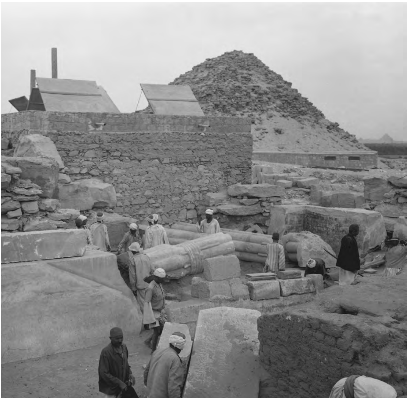
Obr. 3 Zlomené osmistvolové lotosové sloupy krátce po nález / Fig. 3 Broken eight-stalk lotos columns shortly after the discovery

intrik a spiknutí proti králi. Možná se Žába chtěl tomuto problému důkladněji věnovat ve své budoucí edici výzdoby Ptahšepsovy hrobky, osud však rozhodl jinak.