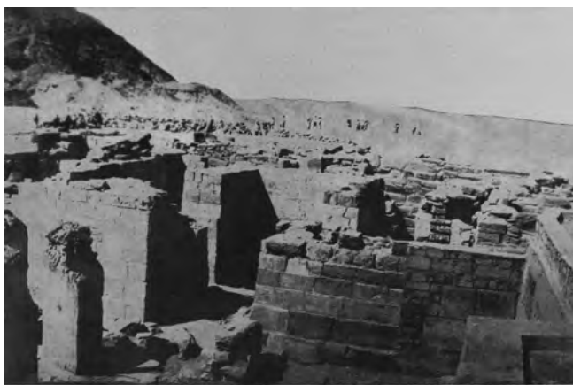
PRELIMINARY REPORT ON CZECHOSLOVAK EXCAVATIONS IN THE MASTABA OF PTAHSHEPSES AT ABUSIR

Excavations in the Mastaba of Ptahshepses at Abusir , Prague: Charles University, s. 29–32.