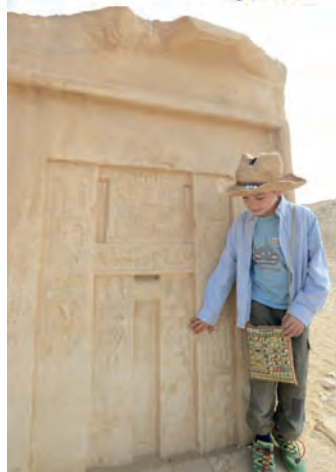
nepravé dveře Tetiho I.