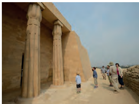
Lotosové sloupy u Ptahsepsesovi mastaby Muserova pyramida a odvedňovací kanál