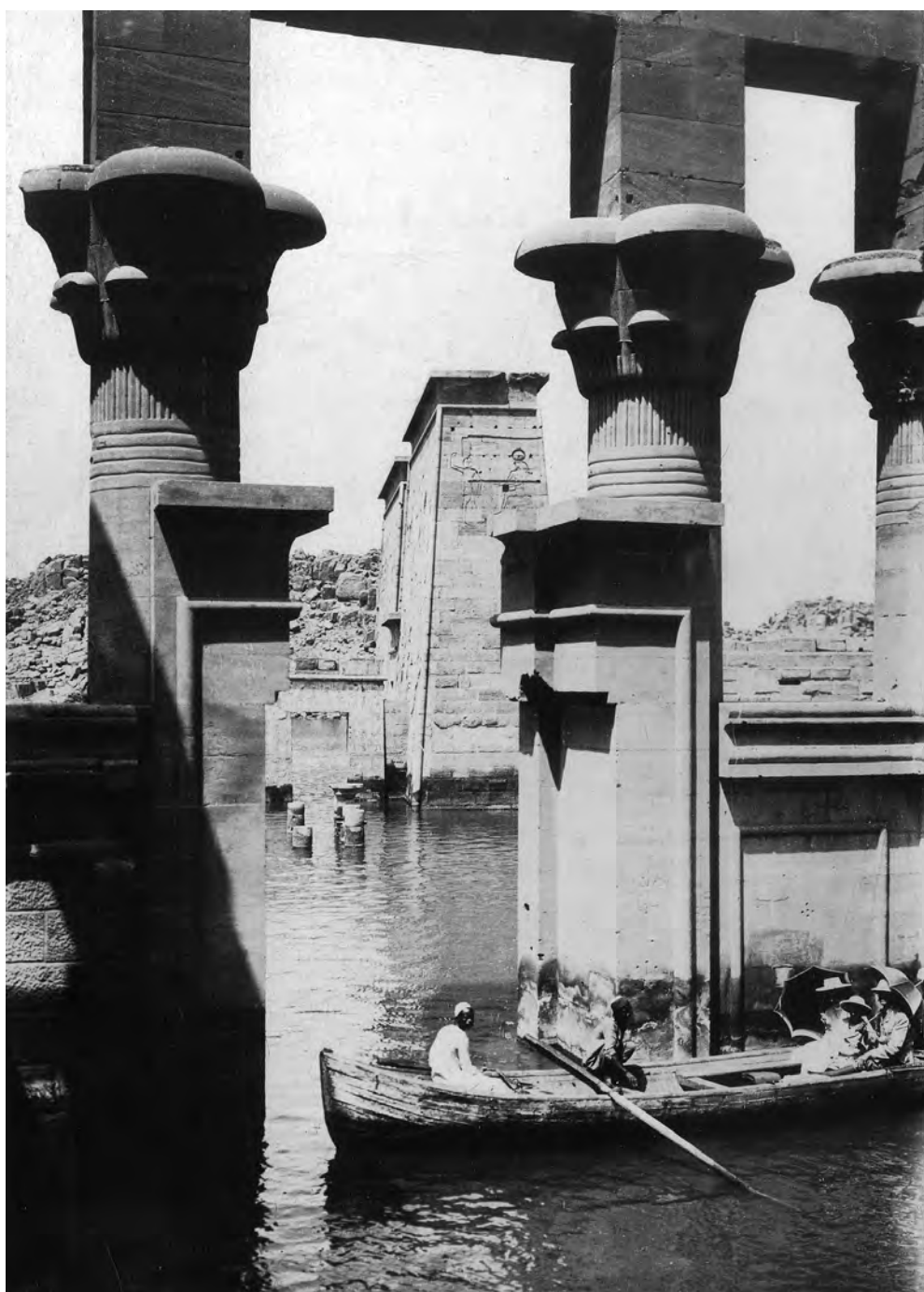
Obr. 6 Chrám z ostrova Filé v době stavby přehrady a plnění Násirova jezera

Kromě těchto důsledků musely egyptská a súdánská vláda čelit také velké odpovědnosti vůči světovému historickému dědictví, neboť zaplavením tak velkého území plánovanou přehradní nádrží byly ohroženy všechny tamější historicky cenné doklady. Jejich záchrana vyžadovala