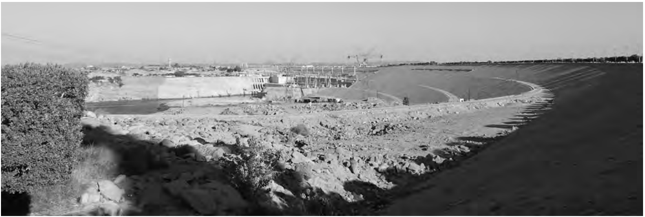
Obr. 5 Vysoká přehrada v Asuánu