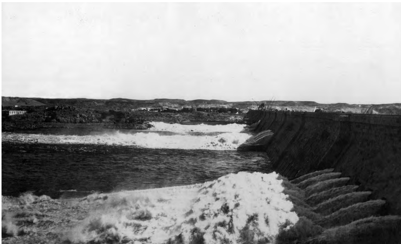
Obr. 4 Asuánská přehrada nabízela jen dočasné řešení