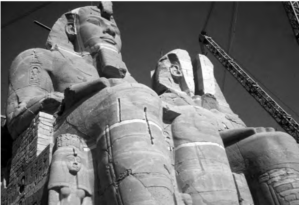
Obr. 7 Přesouvání chrámu Ramesse II. v Abú Simbelu

ohromné vědecké, technické i finanční nasazení, které bylo za hranicemi možností obou zemí. Proto oslovily organizaci UNESCO, jež jejich výzvu roku 1959 vyslyšela.