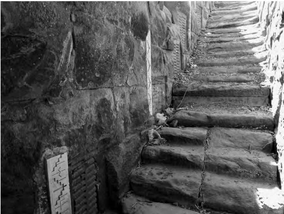
Obr. 2 Nilometr sloužící k měření výše každoroční nilské záplavy na ostrově Elefantina v Asuánu

státní správě na základě naměřené výše záplavy včas reagovat a nešťěstí do určité míry předcházet.