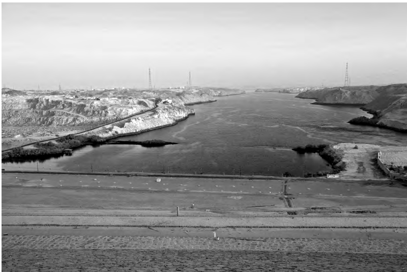
Obr. 1 Pohled na nilský tok z Vysoké přehrady u Asuánu