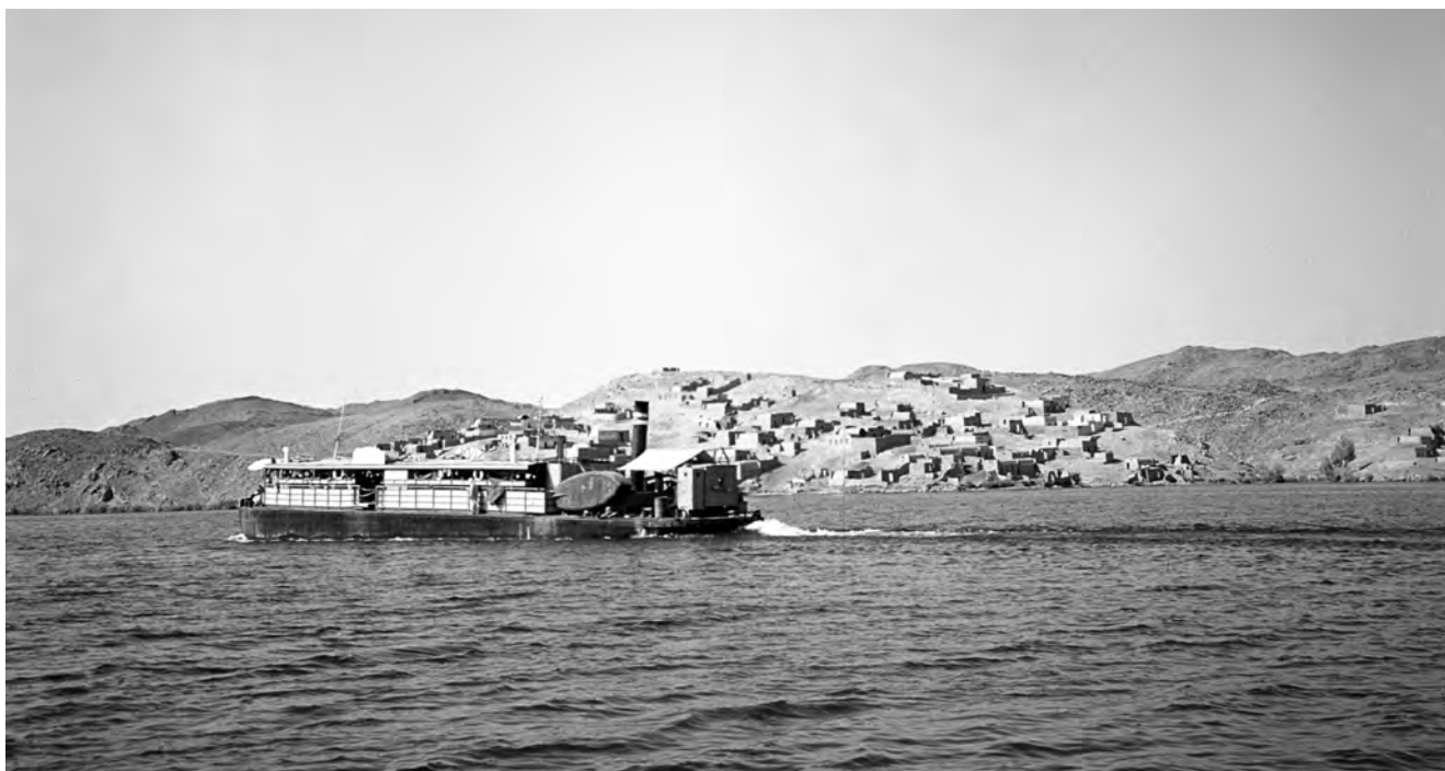
Obr. 10 Bábúr súdáni, „Súdánský sršeň“, parník, který pendloval jedenkrát týdně mezi Asuánem a Wádí Halfou a zpět