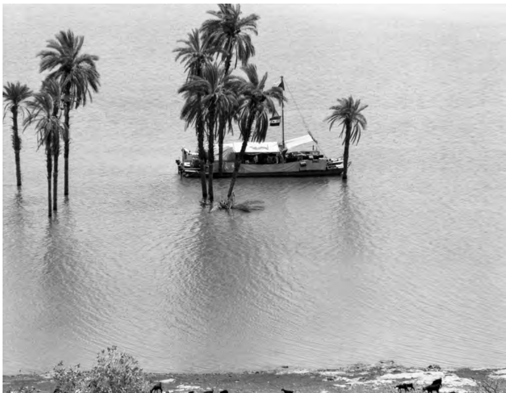
Obr. 2 Katamarán Sadiq en-Nuba , „Přítel Núbie“, kotvíci mezi částečně zatopenými palmami

K tvrdým podmínkám, za nichž náš tým v Núbii pracoval, přispíval i velmi skrovný a především jednotvárný jídelníček. V té době byl v Egyptě – jak jinak, když se vydal na cestu k socialismu – velký nedostatek potravin a spotřebního zboží. Zásoby potravin, i s ohledem na jejich dopravu a skladování, si před cestou do Núbie náš tým kupoval z velké části až v Asuánu. Jejich základem byla rýže, kondenzované mléko, sardinky, mleté skopové maso v konzervách a cibule. K tomu, abychom si například v Nilu lovili ryby, jsme neměli dost času, a jak se ukázalo, ani zkušeností. Jen výjimečně se u naší lodi zastavil některý z egyptských rybářů a kuchaři Ahmadovi nějakou rybu prodal. Deficit čerstvé zeleniny a ovoce jsme řešili svépomocí: Pokud jsme s lodí kotvili poblíž některé z tehdy již opuštěných núbijských vesniček (obr. 7), mimochodem na rozdíl od Egypta velmi čistých a s hlíněnými domky bohatě zdobenými barevnými ornamenty (obr. 8 a 9), vydali jsme se vpoledne do opuštěných zahrádek nasbírat limetky, okurky a melouny. Velkým a jen dost vzácným zpestřením našeho jídelníčku byl puding, který nám Ahmad servíroval na jídelní stůl ve velkém plastovém lavoru.