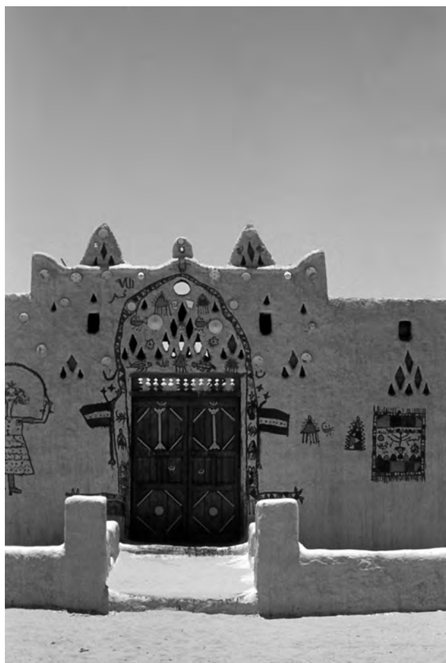
Obr. 8 Lidovými ornamenty bohatě zdobené průčelí núbijského domu

Ničemu jsme nerozuměli, celá událost, která trvala jen chvíli, nám připadala neskutečná. Ještě dlouho po odplutí lodi jsme přemýšleli, proč jsme na její palubě viděli jen hezké dívky a žádné jiné turisty. Teprve až po návratu do Káhiry se nám podařilo zjistit, že se v té době konala v jednom ze zdejších mezinárodních hotelů nějaká módní