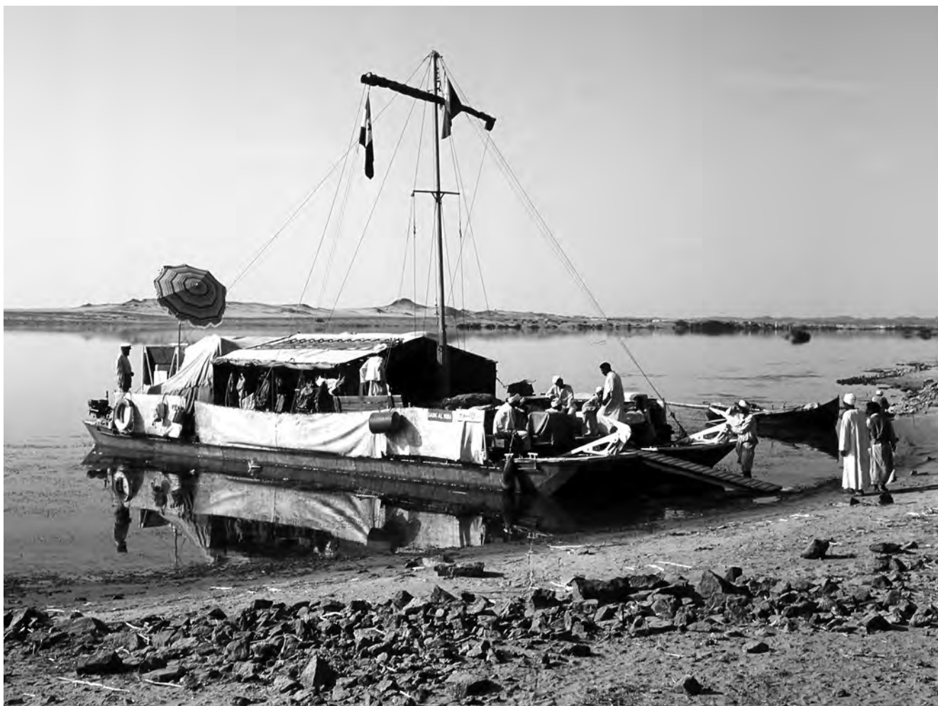
Obr. 1 Katamarán Sadik en-Núba , „Přítel Núbie“, plovoucí základna československé egyptologické výpravy v Núbii