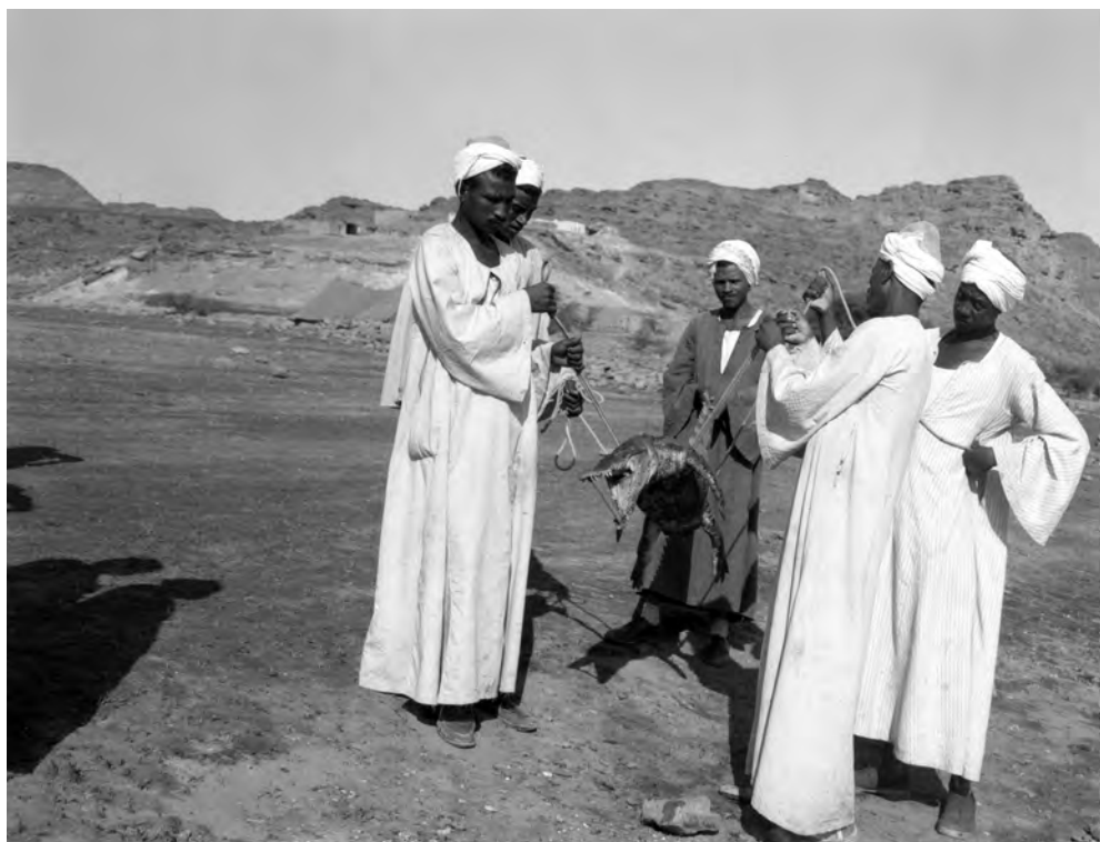
Obr. 11 Egyptští dělníci doprovázející naši výpravu s čerstvým úlovkem mladého krokodýla

Až jednou fotograf Jarda Novotný k Badrovi prohodil poznámku, aby zkusil koupit cigarety na parníku Bábúr súdání , který jednou týdně pendloval mezi Asuánem a Wádí Halfou. To, co náš fotograf mínil žertem, Badr vzal vážně. Když se jednou v podvečer objevil na obzoru „Súdánský sršeň“, požádal Badr o nafukovací gumový člun a pádloval parníku vstříc. Za chvíli jsme viděli uprostřed řeky Badrova drobnou postavičku v bílé galáběji mávat pádlem. K našemu překvapení začal obrovský parník s řinčením a rachotem ubírat rychlost a z paluby shodili provozový žebřík. Badr hbitě skočil na žebřík a vyšplhal na palubu. Napjatě jsme sledovali, co se bude dít. Chvilí se nedělo nic a pak jsme uviděli bílé klubíčko Badra ve vzduchu galáběji letět přes palubu, parník zafuněl a znovu vyrazil kupředu. Když se Badr vrátil, odšoural se stranou a jen seděl jako ta příslovečná zmoklá slepice a mlčel. Teprve po dlouhé chvíli tiše poznamenal: „ Reis el markab