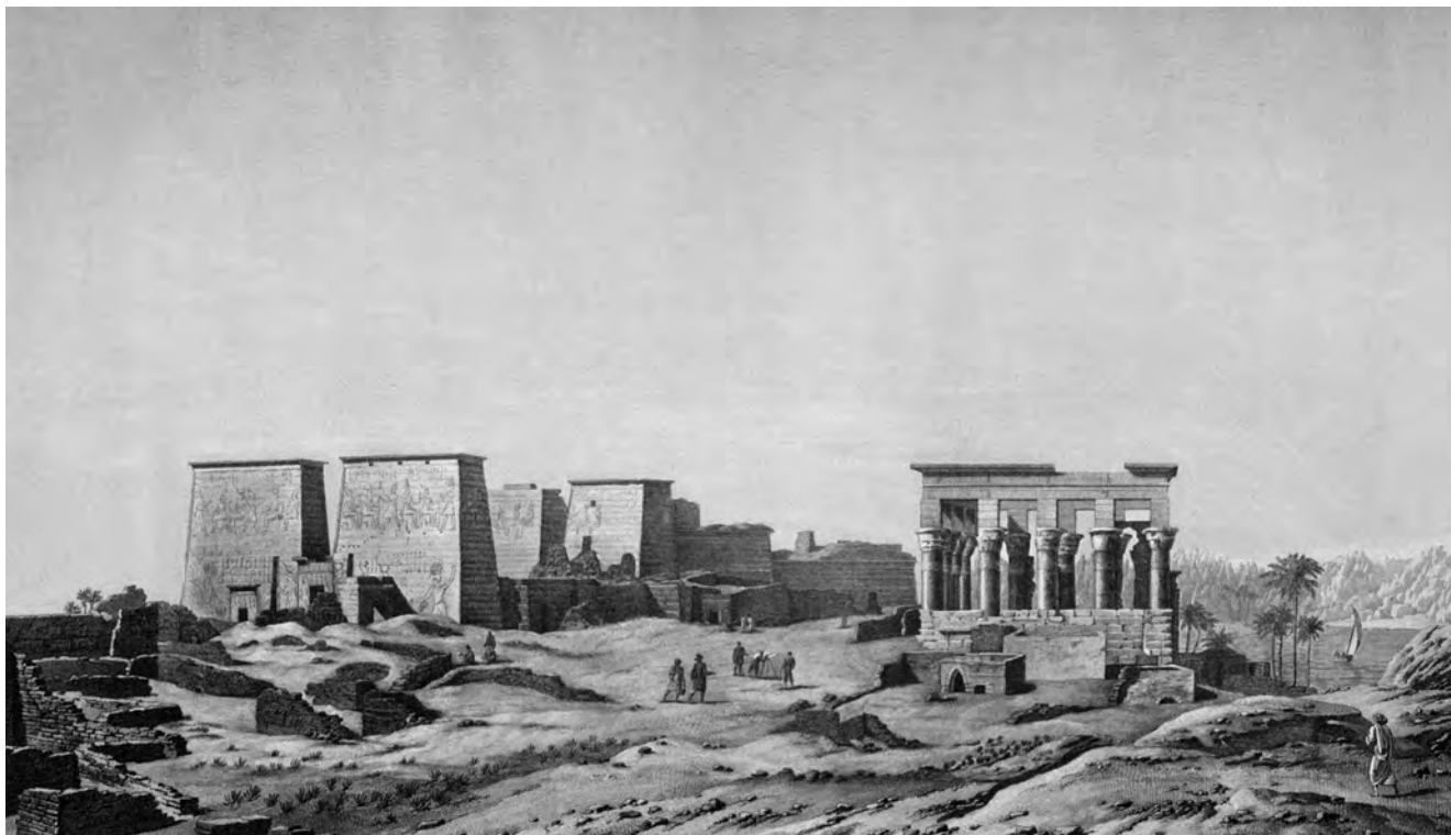
Obr. 12 Chrám na Fílé v době Napoleonovy výpravy do Egypta ( Description de l'Égypte 1820 : Pl. 26)