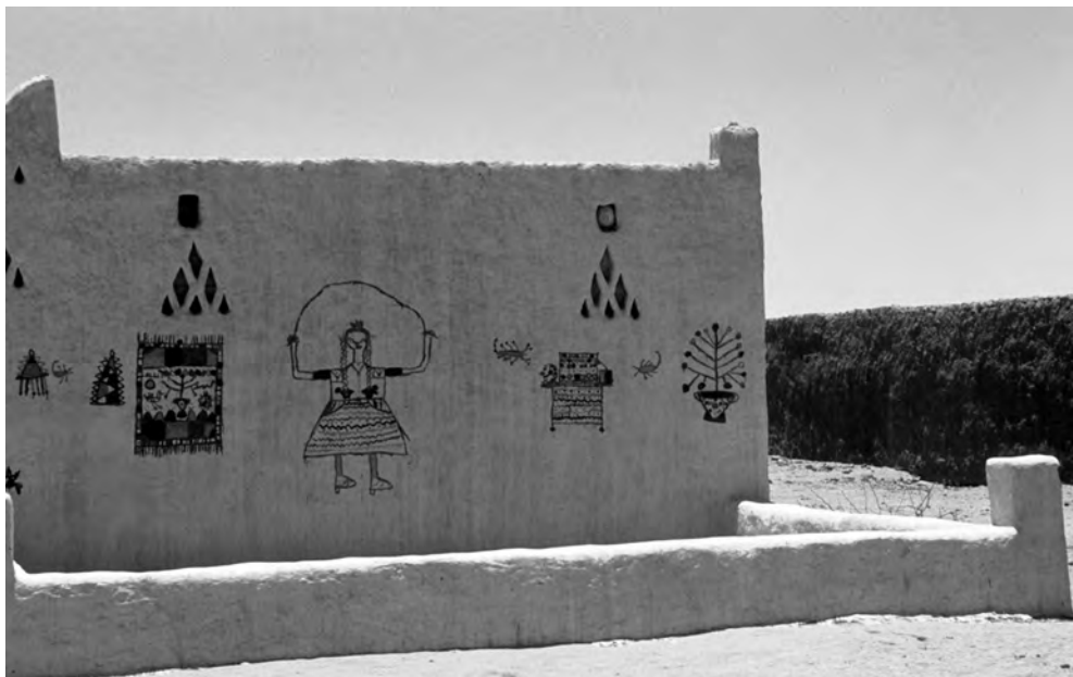
Obr. 9 Lidovými ornamenty bohatě zdobený nubijský dům – pohled z boku

přehlídka. A tak jsme dospěli k názoru, že to snad byly modelky, které se po skončení přehlídky vydaly na návštěvu Abú Simbelu. A nebo přece jen fata morgana?