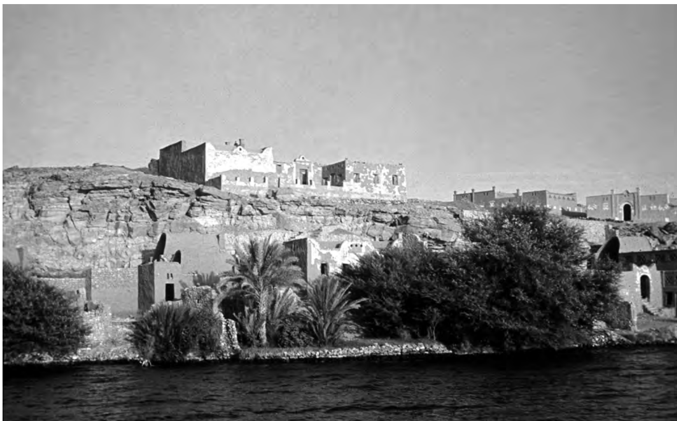
Obr. 7 Pohled na núbijskou vesnici

obrovský starý parník, jenž zejména osvětlený v noci vypadal velmi majestátně. Mezi pravidelné spoje patřila i dvojice moderních rychlých lodí, jimž Egypťané říkali „raketa“ a které ráno vyplouvaly z Asuánu s turisty ke skalnímu chrámu Ramesse II. v Abú Simbelu a odpoledne se vracely zpět. Jedna se jmenovala Nefertiti a druhá Kleopatra.