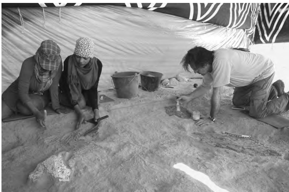
Obr. 11 Při konzervování nástěnných maleb v Chrámě 3 pomáhaly praktikantky ze soudánské památkové správy