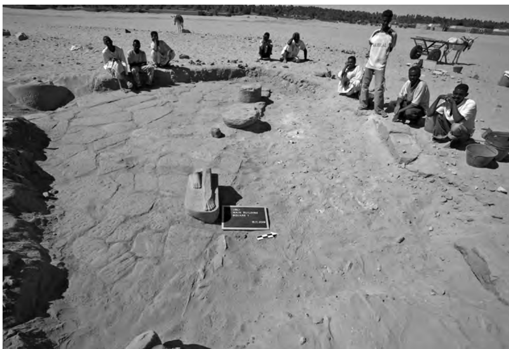
Obr. 8 Chrám 1, čtverec 9, podlaha dlážděná pískovcovými bloky s bázemi sloupů a destrukcí pískovcového zdiva

artefaktů zdobených zlatým plátováním. Konkrétně se nálezy koncentrovaly v sondě 8 a souvisely snad se zlatým plátováním nábytku či dřevěné sochy.