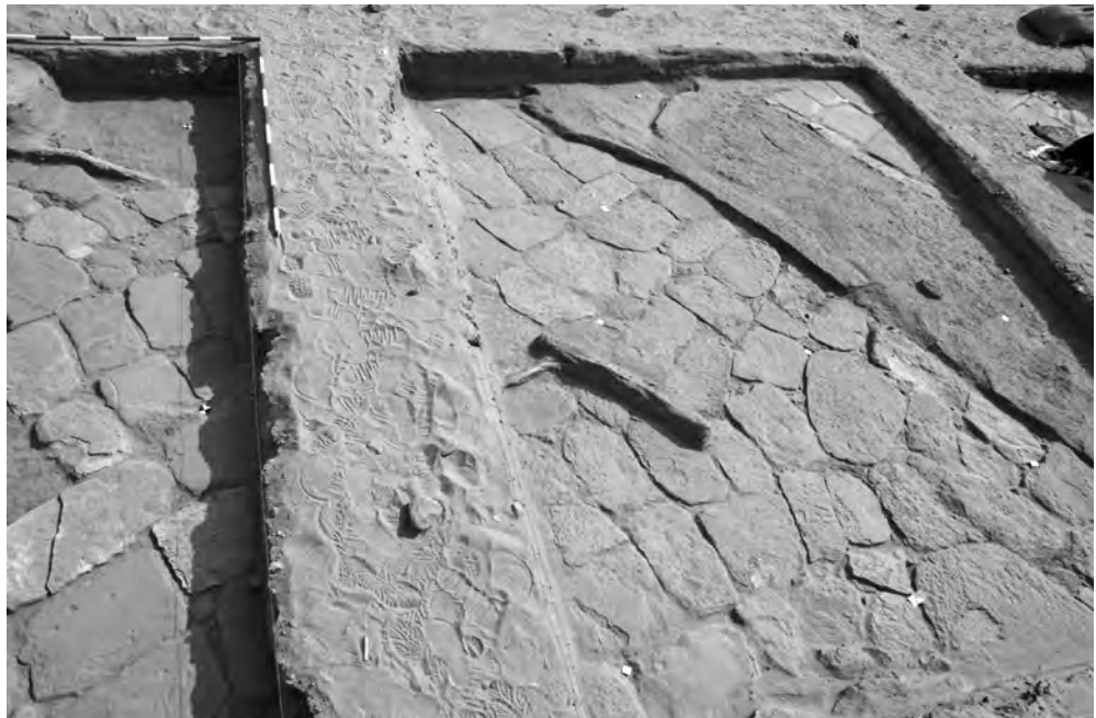
Obr. 9 Chrám 3, sonda 3 se severní stěnou chrámu, s interiérovou dlažbou v jihovýchodním rohu a s dlažbou nádvoří vně chrámu

resp. jejího fragmentu, s plastikou krokodýla na okraji (paralela k ní je známa z napatského období např. z lokality Kawa; Welsby 2004: 155, Fig. 139). Část keramiky odkryté v roce 2014 však může být datována i do období Nové říše. Je třeba mít na paměti, že zde hovoříme především o artefaktech nalezených v troskách chrámu. Chrám sám o sobě však mohl být i staršího založení (Nová říše) a nález báze sochy a napatské keramiky může souviset s kontinuitou jeho užívání. V tomto bodě výzkumu je možné předchozí diskusi uzavřít konstatováním, že chrám architektonicky vykazuje rysy typické pro novoříšskou architekturu, část nálezů však odpovídá datování do napatské doby. Je tak možné předpokládat, že chrám byl využíván delší dobu.