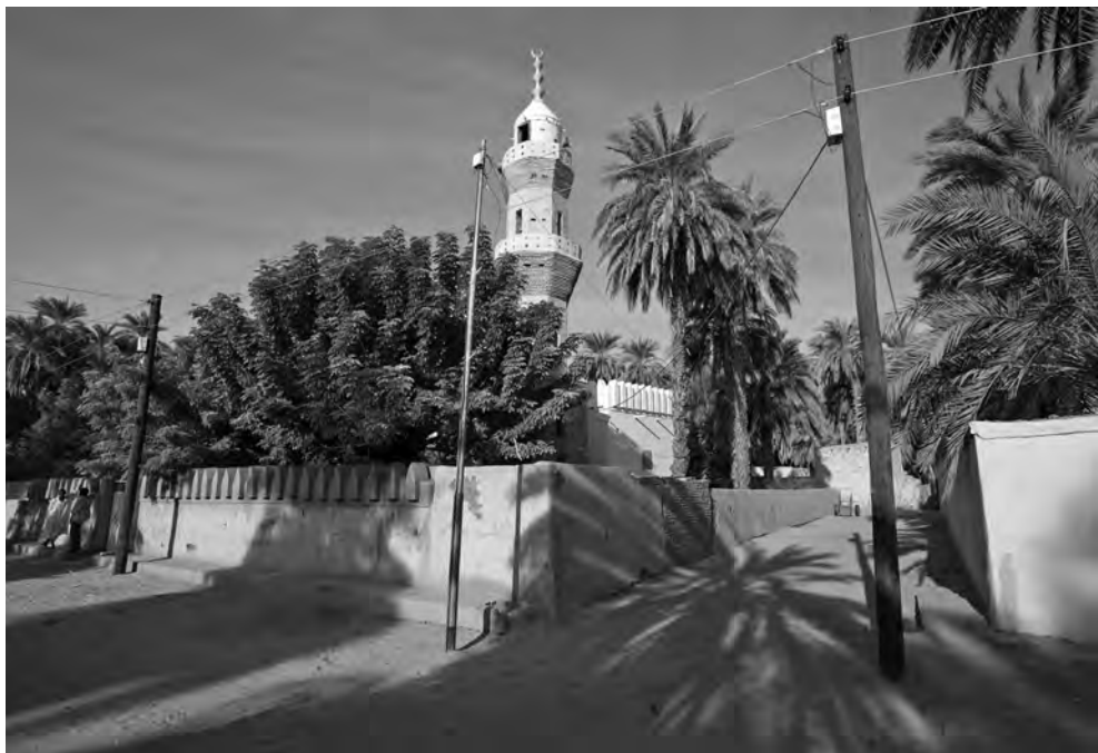
Obr. 4 Jedna z mešit v Usli, v jejímž okolí se nacházejí pískovcové bloky z původních starověkých chrámů

činění s poměrně velkým a mnohvrstevným osídlením s několika funkčně rozrůzněnými druhy staveb (obr. 4).