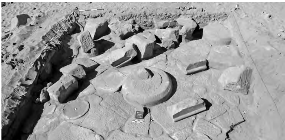
Obr. 5 Chrám 1, objev napatské sochy panovníka in situ

Již zmíněný pískovcový Chrám 1 jsme podrobili plošnému odkryvu v celkem deseti čtvercích o rozměrech 10 \times 10 či 5 \times 5 m (s kontrolními profily mezi sondážními čtverci). Tento výzkum odkryl pozůstatky rozsáhlé poškozené chrámové architektury. Chrám byl tvořen třemi oddělenými částmi. Jeho dlouhá osa směřovala od severozápadu k jihovýchodu, tedy příčně ke zdejšímu toku Nilu. Podlaha chrámu byla vydlážděna plochými pískovcovými bloky. V jednom místě (mezi sondami 1 a 2) obsahovala dlažba druhotně použitý buben sloupu o průměru 80 cm, který by mohl pocházet ze starší monumentální stavby předcházející Chrámu 1 (srov. Spence et al. 2009: 39, plate 2). Pozůstatky bílého nátěru na povrchu mnoha podlahových bloků naznačují, že podlaha byla původně omítnuta, nebo alespoň natřena. Po svém zániku byl chrám skoro beze zbytku rozebrán – jeho zdivo se dochovalo jen do výšky podlahy a v některých místech zůstaly jen masivní základové bloky indikující založení stěn. Stěny chrámu byly bezesporu opatřeny reliéfní výzdobou