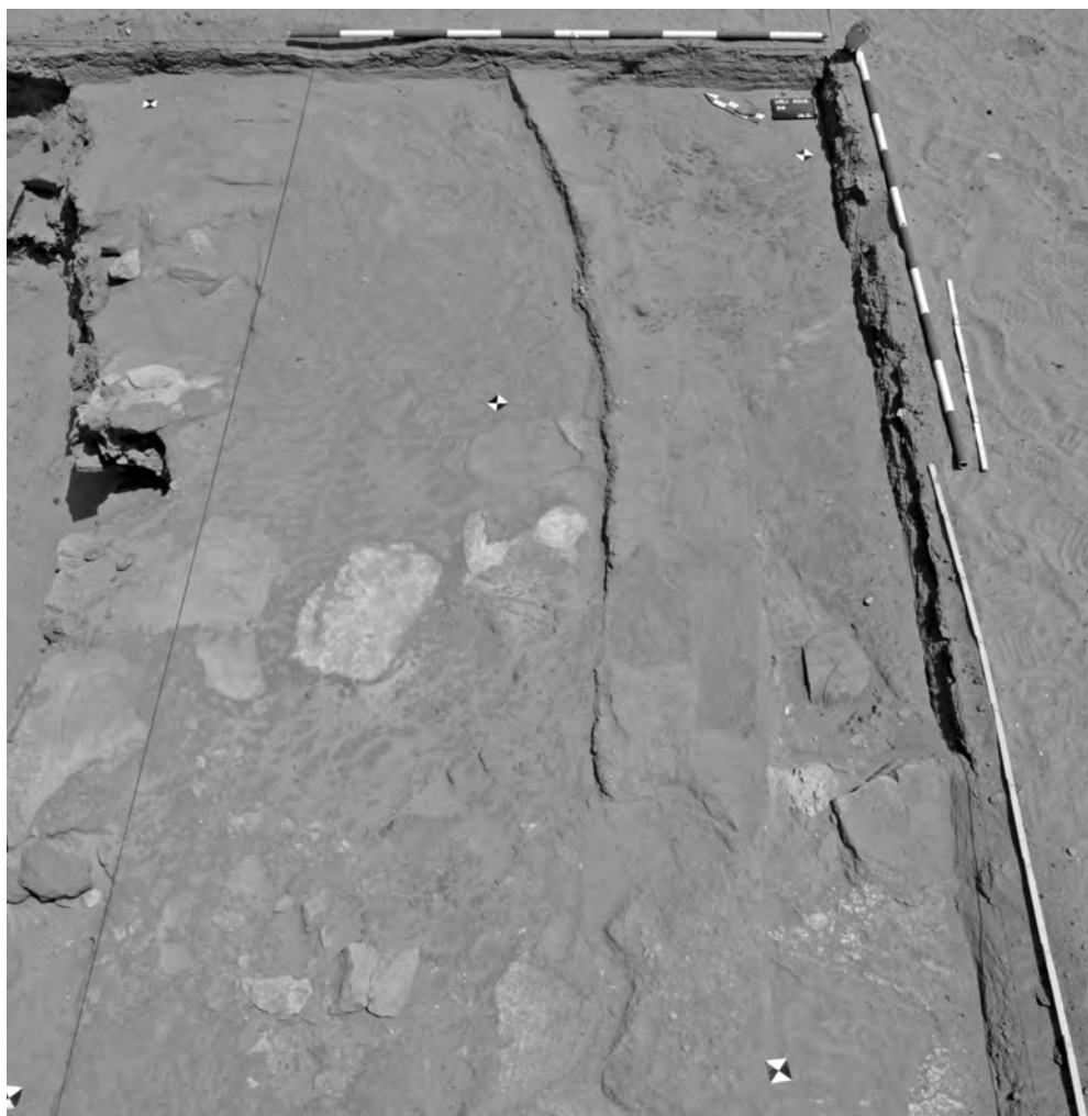
Obr. 13 Chrám 3, sonda 8, povrch okraje kruhové struktury narušující stěnu chrámu a dlažbu nádvoří