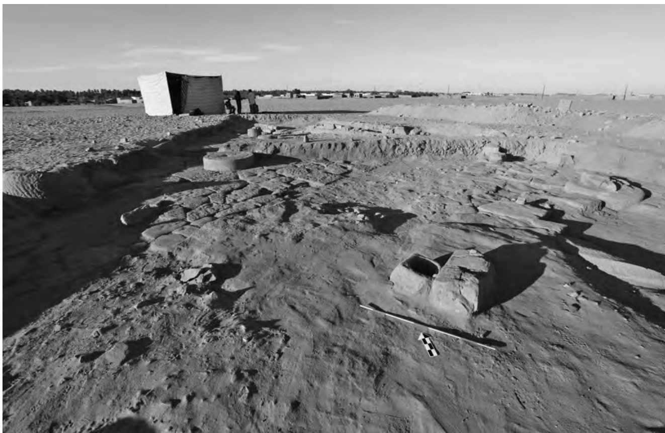
Obr. 1 Chrám 1 během výzkumů