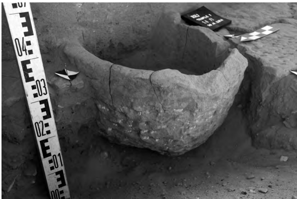
Obr. 7b Chrám 1, sonda 9, nahruho opracovaná báze nádrže po částečném sejmutí dlažby