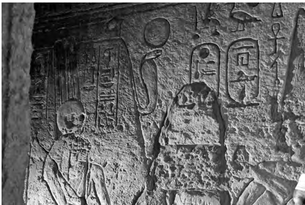
Obr. 2 Detail znázornění posvátné hory s kobrou v kapli chrámu bohyně Hathory, Džebel Barkal

Jak už bylo zmíněno ve zprávě z roku 2013 (Bárta et al. 2013a), obyvatelé Usli zde údajně našli bronzovou sošku bohyně, která by mohla být interpretována jako bohyně Bastet nebo Sachmet (Żurawski 2000: 285). Další nálezy z období Kermského (asi 2500–1500 př. Kr.), napatského, postmerojského a křesťanského zde byly objeveny polskou expedicí vedenou Michalem Bieniadem (Bieniada 2006).