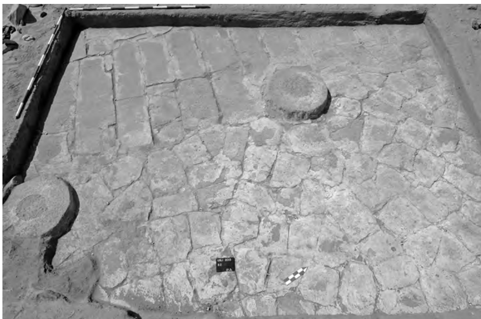
Obr. 10 Chrám 3, sonda 2 po vyzvednutí nástěnných maleb. Podlaha ve východní části sondy se skládá z menších pískovcových bloků pokrytých nátěrem bílé maltové omítky. Podlaha západně od bází sloupů se skládá z dlouhých obdélných bloků