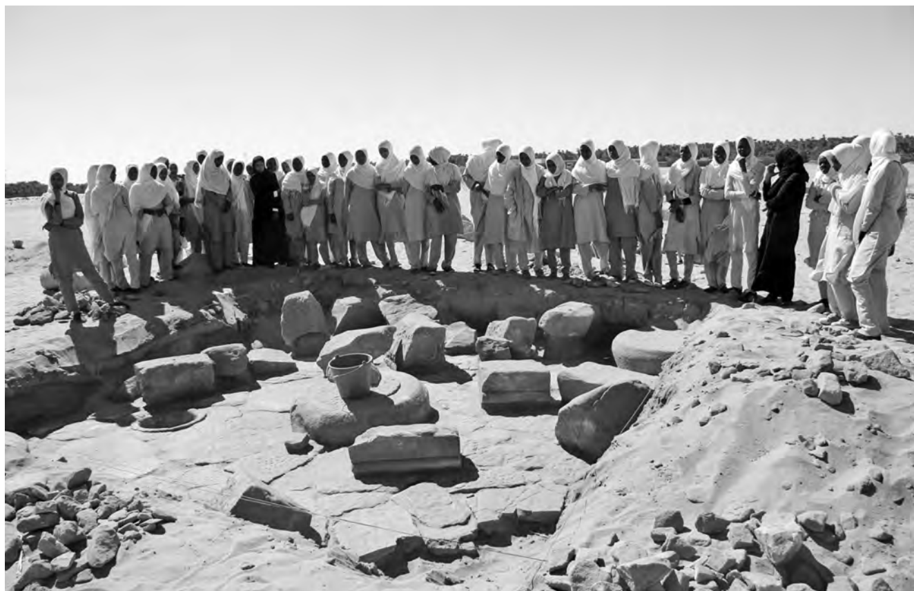
Obr. 14 Chrám 3, žákyně místní školy nad archeologickými sondami. Osvěta je účinnou prevencí při památkové ochraně lokality