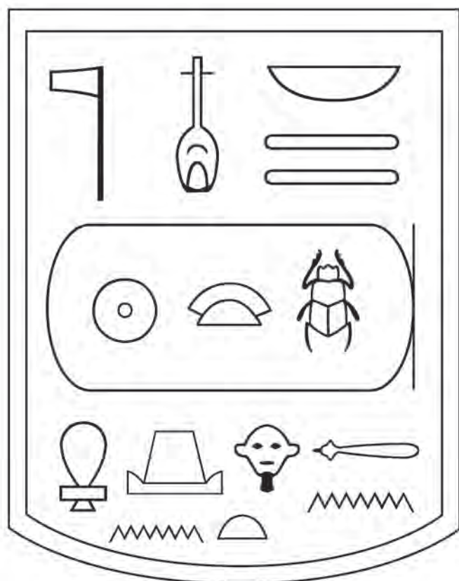
Obr. 2 Pečeť sýpky Senusreta II. nalezená v Mirgisse (kresba J. Malátková)

žených sýpek a kontejnerů díky přestavbám kolísala mezi 16 a 24 m 2 . Největší plochu přitom skladovací prostory zabíraly v prostřední stavební fázi a nejmenší v té poslední (Von Pilgrim 1996: 233). Je třeba zdůraznit, že taková skladovací kapacita byla mezi domy nalezenými na Elefantině vskutku jedinečná a převyšovala běžnou plochu skladovacích prostor téměř desetinásobně (Von Pilgrim 1996: 233).