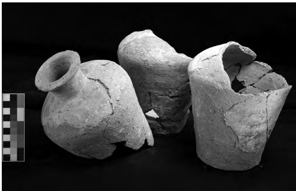
Obr. 2 Čiastočne dochované džbány z pohrebnej výbavy hodnostára Duaptaha

razne prevažovali pivné džbány (114 diagnostických fragmentov a minimálne 27 jednotlivých nádob) a misy (minimálne 28 rôznych exemplárov). Len 25 nádob sa zachovalo v kompletnom tvare (konkrétne 21 miniatúrnych misiek) alebo aspoň v kompletnom profile (4 podnosy).